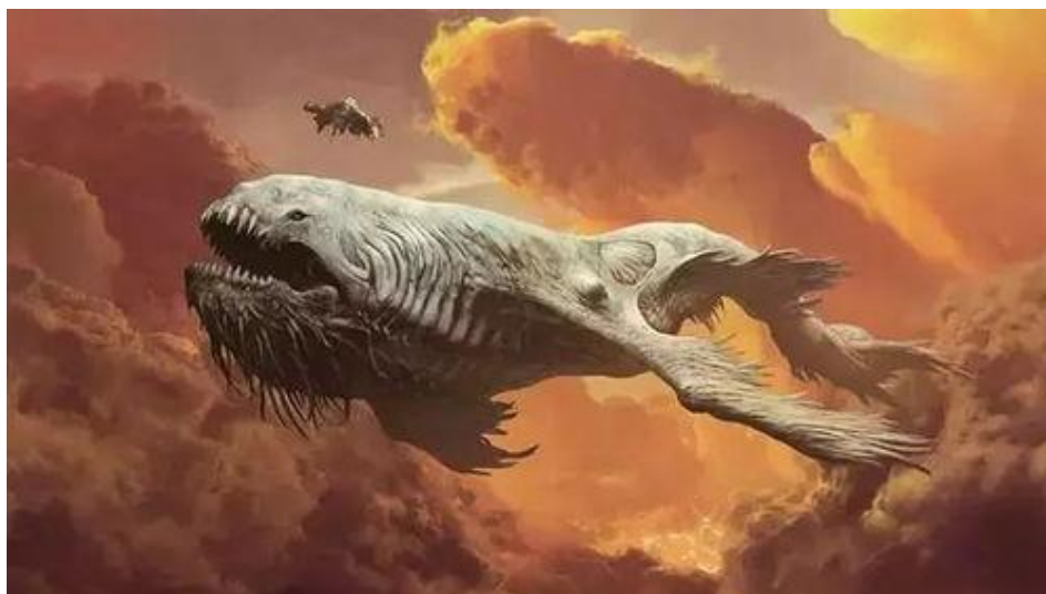
利维坦（Leviathan）字意为裂缝，《圣经》象征邪恶的一种巨型海怪，恶魔的代名词。